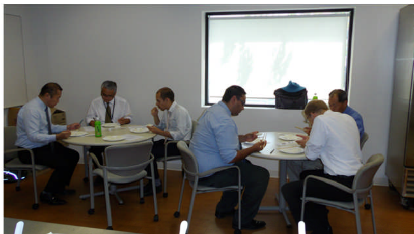
写真1 JFCにおける食味官能試験の光景。

米の食味評価は写真 1 に示したように、松江方式の少数パネル、多数試料による食味官能試験（松江 1992）で実施した。基準品種には JFC では望、FRC では牡丹を用いて、1 回の試験で基準品種を含めて 5 点の材料を同時に評価した。基準品